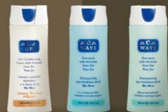
vlasová kozmetika C-WAVE C-CURE