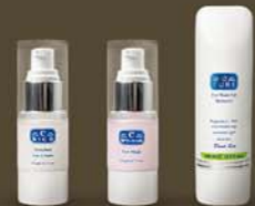
starostlivosť o očné partie C-RICH C-PURE C-OPTI. MASK