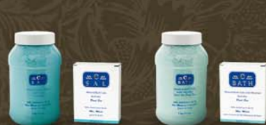
solí do kúpeľa C-SAL C-BATH