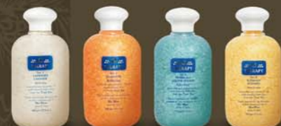
aromatické solí do kúpeľa C-THERAPY NO. 1 C-THERAPY NO. 2 C-THERAPY NO. 3 C-THERAPY NO. 4