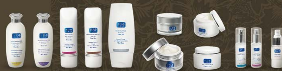
starostlivosť o pleť C-CLEAN C-TONE C-SCRUB C-MASK C-MASK PLUS C-CARE C-FAIR C-DERM C-DERM PLUS C-MIST C-MIST PLUS C-SERUM