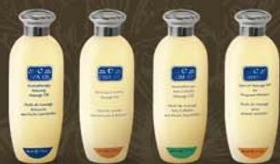
masážne oleje C-SPA OIL C-SLIM OIL C-COOIL C-STRETCH OIL