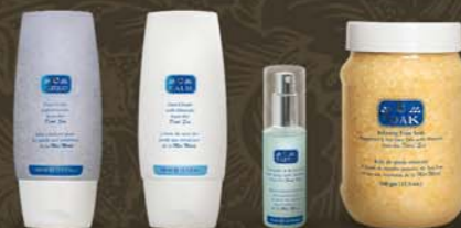
starostlivosť o nohy C-EXFOLIO C-BALM C-SOAK C-FRESH