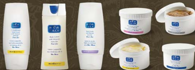
starostlivosť o telo a ruky C-SILK C-TOUCH C-AROMA C-GLOW C-MUD C-SPA C-SLIM