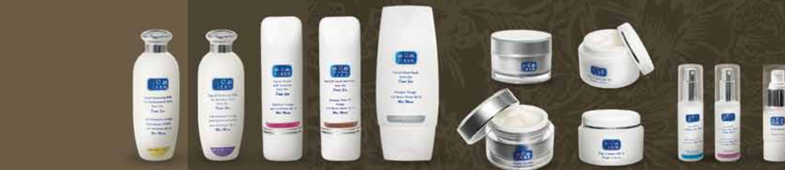
starostlivosť o pleť C-CLEAN C-TONE C-SCRUB C-MASK C-MASK PLUS C-CARE C-FAIR C-DERM C-DERM PLUS C-MIST C-MIST PLUS C-SERUM