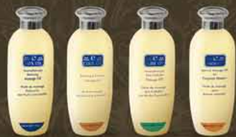
masážne oleje C-SPA OIL C-SLIM OIL C-COOLOIL C-STRETCH OIL