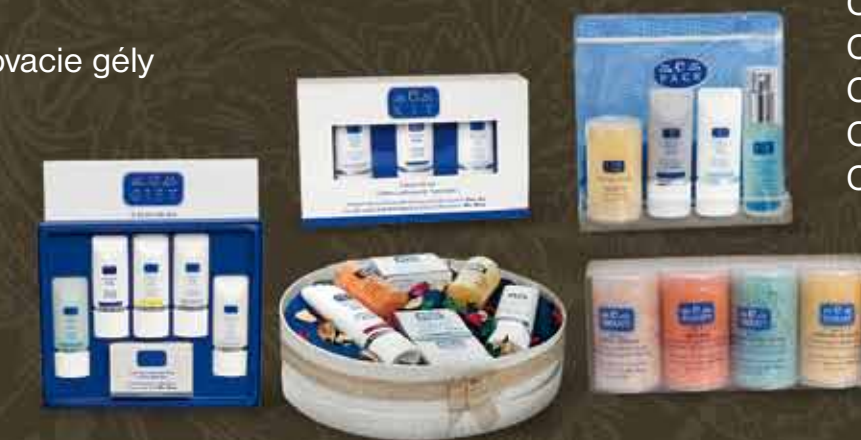
darčkové balenia C-GIFT C-KIT C-BOX C-THERAPY COMBO C-PACK