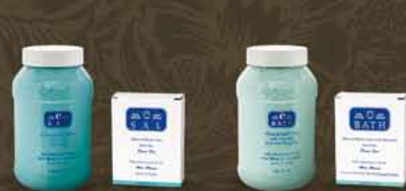
solí do kúpeľa C-SAL C-BATH