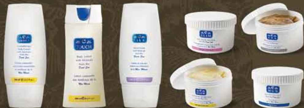
starostlivosť o telo a ruky C-SILK C-TOUCH C-AROMA C-GLOW C-MUD C-SPA C-SLIM