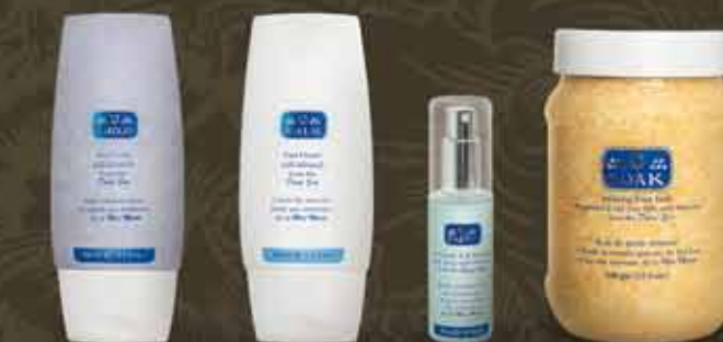
starostlivosť o nohy C-EXFOLIO C-BALM C-SOAK C-FRESH