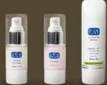
starostlivosť o očné partie C-RICH C-PURE C-OPTI. MASK