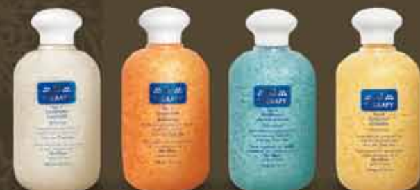
aromatické solí do kúpeľa C-THERAPY NO. 1 C-THERAPY NO. 2 C-THERAPY NO. 3 C-THERAPY NO. 4