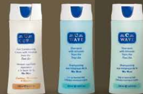
vlasová kozmetika C-WAVE C-CURE