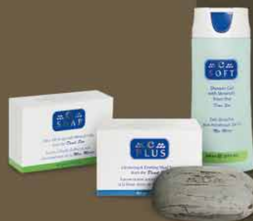
mydlá a sprchovacie gély C-SOAP C-PLUS C-SOFT